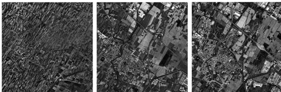
Fig. 4 Campi Bisenzio 1954-1988. La sequenza di fotografie aeree documenta il radicale cambiamento avvenuto tra il 1954 e il 1978 nella Piana di Firenze. Il mosaico di campi coltivati evolve in un disegno a larghe maglie, mentre Campi Bisenzio si trasforma in una città che ingloba le frazioni di S. Martino, S. Giusto e Capalle. Si riconoscono alcune permanenze come l'autostrada Firenze-mare (1923) che taglia la geometria del terreno, il corso sinuoso del Bisenzio e quello più lineare dei torrenti Marina e Garille. Gli argini del collettore acque basse, il Fosso Reale, intersecano l'Autosole, grande opera datata 1963. Dopo il 1978 si registra una crescita edilizia meno imponente e interventi più strutturali, come il complesso nodo di svincolo A1-A11, la discarica di Case Passerini, le rotonde della nuova circonvallazione, il parco di Villa Montalvo

L'area critica per eccellenza è tuttavia l'area metropolitana centrale, polarizzata attorno alle tre città di Firenze, Prato e Pistoia, dove maggiore è la concentrazione di attività produttive e di scambio di beni e di servizi e massima è la densità residenziale e di infrastrutture.