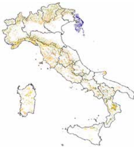
Scansione dei fogli e loro georeferenziazione (Roma 40 - Gauss-Boaga Fuso Est e Fuso Ovest).

dall'Italia in seno alla Convenzione delle Nazioni Unite sui Cambiamenti Climatici – UNCCC e in particolare al suo strumento operativo denominato Protocollo di Kyoto - PK).